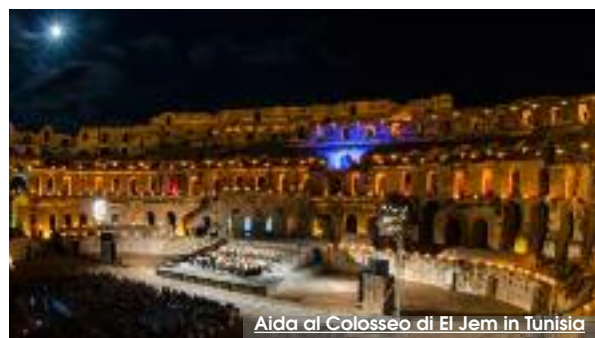
Aida al Colosseo di El Jem in Tunisia

"Tutto sommato non mi sento tradito dalla mia patria, i problemi che ci sono e che abbiamo visto negli anni li sto prendendo in positivo come una sorta di allenamento per superare le traversie. Non credo, oggi, che sia interesse di nessuno sparare contro il Luglio che, in definitiva, si è dimostrato al servizio dell'Amministrazione, della città e ha tenuto ben distante la gestione del teatro da qualsivoglia tentazione di proiettarlo nell'agone politico. Nessuno lo ha più considerato sottogoverno anche perchè non ci sono più i tempi di una volta: un teatro va gestito con criterio aziendale perchè altrimenti tutto ciò che abbiamo