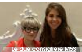
Le due consigliere M5S